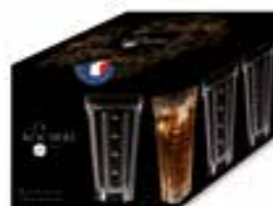
Saga Set de 4 long drink 2 motifs différents

6447 01 H : 15,9 cm / ø : 8,9 cm Cl : 42 / Oz : 14,8 4 360