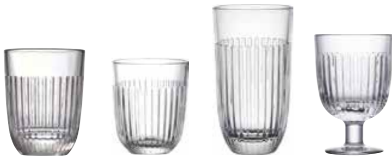
Grand gobelet uni

6471 01 H : 11 cm ø : 8,5 cm Cl : 34 / Oz : 12 6 1140