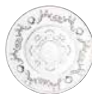
Assiette à pain