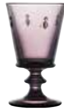
Verre à vin Aubergine* 6110 08