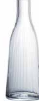
Carafe vénitien fin 4153 01VF H : 27 cm ø : 10,1 cm Cl : 100 Oz : 35,27