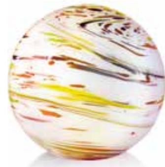
Luminaire MAGNOLIA grand format 1 4141 16 H : 30 cm