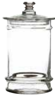
2l 4163 01 H : 27 cm / ø : 13,5 cm Cl : 200 / Oz : 70,5