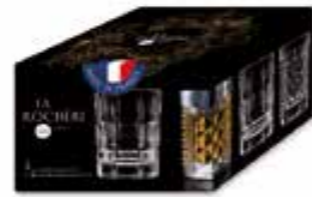
Set de 4 Shooters 2 diamant + 2 taille pointe

6461 01 H : 6,5 cm / ø : 5,1 cm Cl : 4 / Oz : 1,41 6 3360