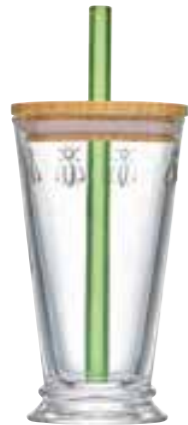
Set Bubble tea

6474 01 H : 9,4 cm ø : 8,1 cm Cl : 32 / Oz : 11,3 4 1248