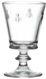
Verre à vin

6110 01 H : 14,1 cm / ø : 8,5 cm Cl : 24 / Oz : 8,5 6 768