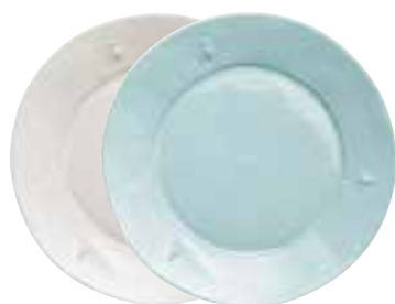
Assiette de service écru