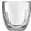
Tasse espresso jeux d'orgues

6373 01 H : 6,3 cm / ø : 6,2 cm Cl : 10 / Oz : 3,53 6 2784