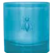
Fleur d'Azur Jasmin, agrumes, rose Jasmins, citrus, rose

6449 18 H : 9,4 cm / ø : 8,1 cm packed by 1