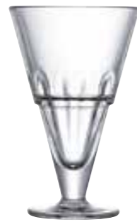
Excelsior haute 6418 01 H : 16,6 cm ø : 10,4 cm Cl : 39 / Oz : 13,76 6 504