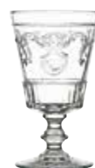
Verre à dégustation 6294 01 40 Cl