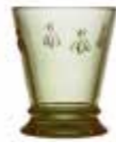
Gobelet olive* 6121 97