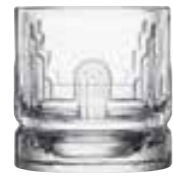
Verre à whisky John

6429 01 H : 9 cm / ø : 8,6 cm Cl : 30 / Oz : 10,58 4 1368