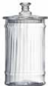
Bocal 1l vénitien fin 4162 01VF H : 24,5 cm / ø : 11,5 cm Cl : 100 / Oz : 35,3