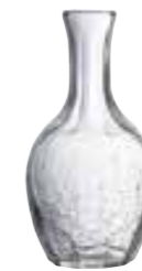
25 cl 5113 01 H : 15,7 cm Oz : 8,8