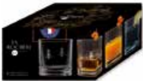
Gobelet à whisky

6474 01 H : 9,4 cm ø : 8,1 cm Cl : 32 / Oz : 11,3 4 1248