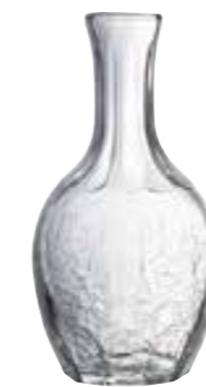
75 cl 5143 01 H : 22 cm Oz : 26,5