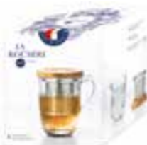
Tisanière Ouessant (1 mug, 1 filtre à thé et 1 couvercle)

6405 01 H : 16,5 cm Cl : 30 / Oz : 10,6 288