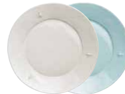
Assiette de service céramique écru (packed by 4 pcs) 5982 20