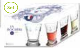
Set de 4 gobelets

6110 01S4 H : 14,1 cm / ø : 8,5 cm Cl : 24 / Oz : 8,5 192