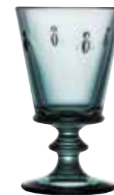
Verre à vin*

6110 48 H : 14,1 cm / ø : 8,5 cm Cl : 24 / Oz : 8,5 6 768