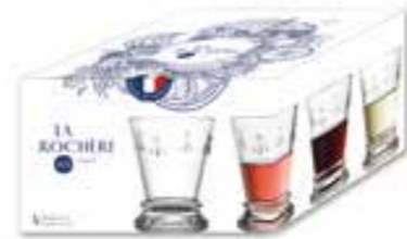
Set de 4 gobelets

6079 01 H : 6,4 cm / ø : 5,3 cm Cl : 6 / Oz : 2,1 6 2520