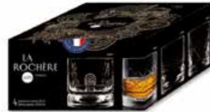
Set de 4 verres à whisky

6431 01 H : 9 cm / ø : 8,6 cm Cl : 30 / Oz : 10,58 4 1368