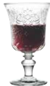
Verre à pied

6051 01 H : 15,4 cm / ø : 9,2 cm Cl : 26 / Oz : 9,17 6 672