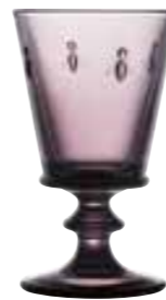
Verre à vin*

6110 08 H : 14,1 cm / ø : 8,5 cm Cl : 24 / Oz : 8,5 6 768