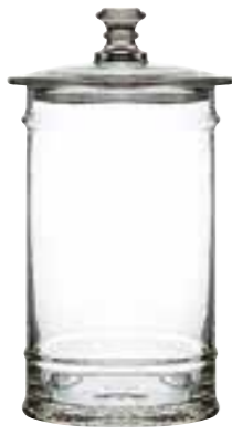
Bocal 4l 4165 01 H : 33,5 cm / ø : 16 cm Cl : 400 / Oz : 141,1