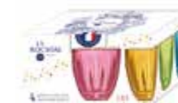
Set 4 Gobelets assortis 6144 96S4 25 Cl