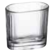
vue de dessus

6426 01 H : 7 cm dim : 7,38*4,68 Cl : 11 / Oz : 3,88 6 3000 3150