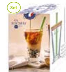
NEW Set Bubble tea 1 long drink, 1 paille en verre verte, 1 couvercle en bambou et 1 brosse de nettoyage

6446 01 H : 11,5 cm / ø : 8,5 cm Cl : 27 / Oz : 9,52 504