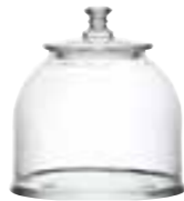
Bocal petit modèle 4581 01 H : 15,5 cm / ø : 17,6 cm Cl : 235 / Oz : 82,9