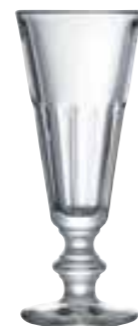
Flûte à champagne

6209 01 H : 14,5 cm / ø : 8,7 cm Cl : 22 / Oz : 7,8 6 672