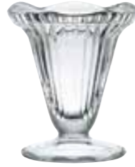
Cadette 6019 01 H : 12 cm / ø : 9,5 cm Cl : 20 / Oz : 7,5 6 660