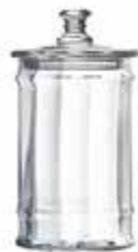
Bocal 1l vénitien large 4162 01VL H : 24,5 cm / ø : 11,5 cm Cl : 100 / Oz : 35,3