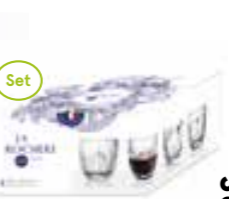
Troquet Set 4 espresso 4 motifs différents

6434 01 H : 12,9 cm ø : 7,85 cm Cl : 30 / Oz : 10,58 4 960