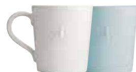
Mug écru ou bleu

5973 20/63 H : 9,3 cm ø : 8 cm Cl : 20 / Oz : 6 (packed by 1 pc)