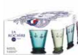
Set de 4 gobelets 4 couleurs assorties 6121 9654