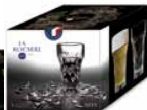
Chope Silex Design Benoît & Rachel Convers

6454 01 H : 9,3 cm / ø : 9,2 cm Cl : 30 / Oz : 10,58 6 1152