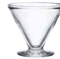
Coupe grand modèle 6327 01 H : 9,3 cm Cl : 22,5 / Oz : 7,74 6 720