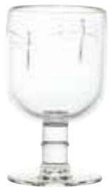
Verre à eau

6324 01 H : 13,5 cm / ø : 7,5 cm Cl : 28 / Oz : 9,9 6 768