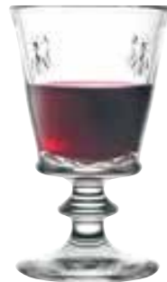
Verre à dégustation

6371 01 H : 16 cm / ø : 9,5 cm Cl : 35 / Oz : 12,3 6 504