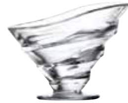
Circée basse 6314 01 H : 10,7 cm / ø : 14,1 cm Cl : 25 / Oz : 8,82 6 468