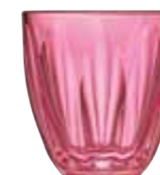
Gobelet framboise 6144 47 25 Cl