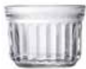
Verrine petit modèle

6423 01 H : 5,3 cm ø : 7,03 cm Cl : 10 / Oz : 3,53 6 3000 540