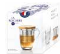
Tisanière 6404 01 36 Cl