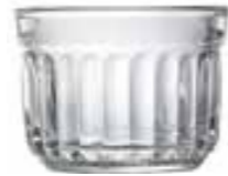
Verrine grand modèle

6419 01 H : 6,2 cm / ø : 8,3 cm Cl : 17 / Oz : 6 6 3000 1536