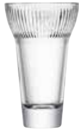
Verre à pastis FANNY

6462 01 H : 13,4 cm ø : 8,1 cm Cl : 22 / Oz : 7,76 6.90LR2.80 6 768