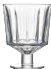
Verre à pied

6386 01 H : 11,4 cm / ø : 8,6 cm Cl : 26 / Oz : 9,17 6 1440