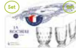
Troquet Set de 4 gobelets 4 motifs différents

6415 01 H : 8,2 cm / ø : 7,8 cm Cl : 23 / Oz : 8,11 364