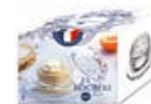
Beurrier 1 cloche + 1 coupelle 6403 01 7 Cl