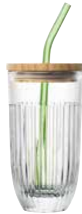
Set Verre à smoothies

avec 1 long drink, 1 couvercle en bambou, 1 paille en verre verte + brosse de nettoyage