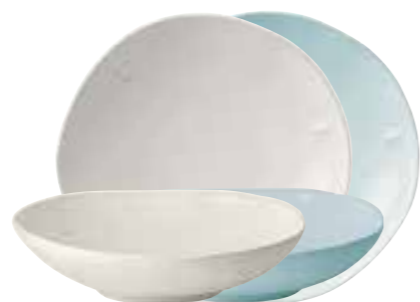
Assiette à pâtes écru ou bleu

5974 20/63 H : 11 cm ø : 10 cm Cl : 52 / Oz : 17,5 (packed by 2 pcs)