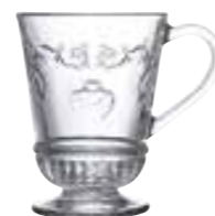
Mug 6389 01 27 Cl