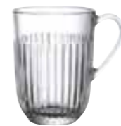
Mug 6313 01 36 Cl