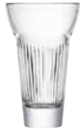
Verre à pastis MARIUS

6462 01 H : 13,4 cm ø : 8,1 cm Cl : 22 / Oz : 7,76 6.90LR2.80 6 768