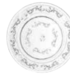
Asiette à dessert 6347 01 ø : 19 cm