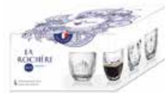
Set 4 tasses 4 motifs différents

6376 01 H : 6,3 cm / ø : 6,2 cm Cl : 10 / Oz : 3,53 6 2784