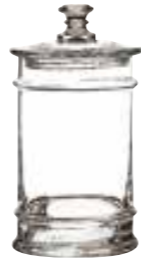
0,5l 4161 01 H : 22 cm / ø : 10,5 cm Cl : 50 / Oz : 17,6