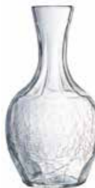
Carafe 100 cl 5145 01 H : 23,5 cm Oz : 35,3