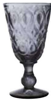
Verre à vin anthracite*

6317 61 H : 16,5 cm / ø : 8,5 cm Cl : 23 / Oz : 8,1 6 672