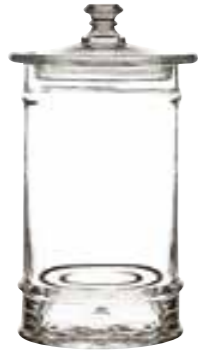
3l 4164 01 H : 30,5 cm / ø : 14,5 cm Cl : 300 / Oz : 105,8