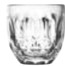
Tasse espresso facettes

6373 01 H : 6,3 cm / ø : 6,2 cm Cl : 10 / Oz : 3,53 6 2784