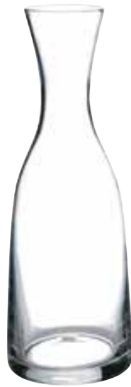
Carafe 100 cl

5170 01 H : 28 cm Oz : 35,3 soufflé bouche / hand made 6 270