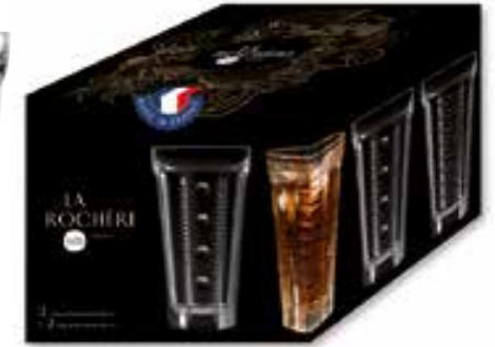
Set de 4 long drink 2 amande + 2 perles

6393 01 H : 14,5 cm ø : 8,44 cm Cl : 34,8 Oz : 12,28 1 768