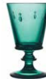
Verre à vin*

6110 03 H : 14,1 cm / ø : 8,5 cm Cl : 24 / Oz : 8,5 6 768