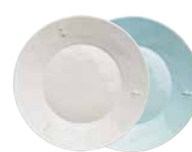
Assiette à dessert céramique écru (packed by 4 pcs) 5981 20