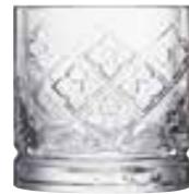
Verre à whisky Patrick

6430 01 H : 9 cm / ø : 8,6 cm Cl : 30 / Oz : 10,58 4 1368