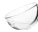
Mise en bouche 6223 01 H : 5,7 cm / ø : 7,7 cm Cl : 5 / Oz : 1,8 6 2520