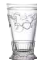
Long drink 6124 01 34 Cl