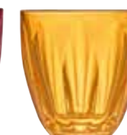
Gobelet mandarine 6144 36 25 Cl