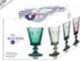
Set de 4 verres à vin couleurs assorties

6110 96S4 H : 14,1 cm / ø : 8,5 cm Cl : 24 / Oz : 8,5 192