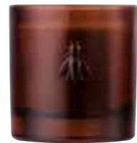
Envolée dans les dunes Orange Blossom Amandes, fleur d'oranger, musc

6449 02 H : 9,4 cm ø : 8,1 cm packed by 1