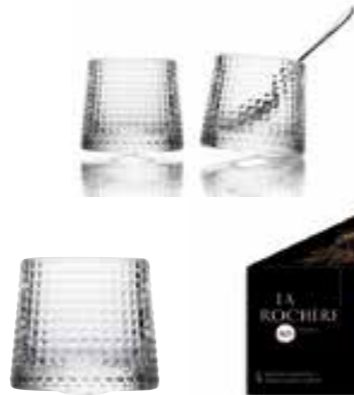
Verre à whisky

6163 01 H : 7,47 cm / ø : 8,05 cm Cl : 16 / Oz : 5,65 4 1140