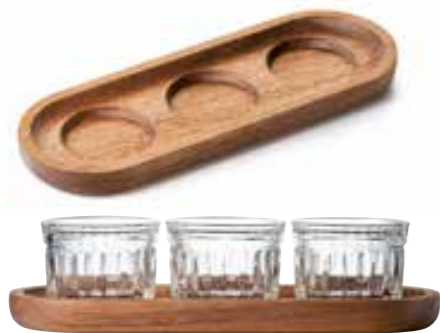
Set Délice 3 verrines Délice 10 cl Design Studio LA RACINE

6438 01 H : 6,8 cm / ø : 7,03 cm Cl : 10 / Oz : 3,53 vendu en coffret couleur 1210 Plateau bois Long. : 25 cm Larg. : 9 cm Ép. : 2 cm