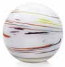
Luminaire globe 1 4481 16 H : 21,5 cm / ø : 23 cm