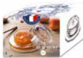
Beurrier Abeille (1 coupelle et 1 cloche)

6402 01 H : 6,5 cm / ø : 9,5 cm Cl : 7 / Oz : 2,47 1155