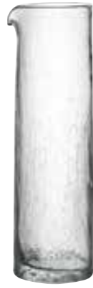
Broc 5561 01 H : 26,4 cm ø : 8,4 cm Cl : 100 / Oz : 35,27