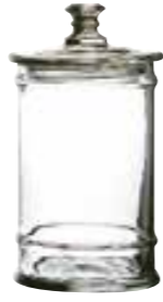
1l 4162 01 H : 24,5 cm / ø : 11,5 cm Cl : 100 / Oz : 35,3