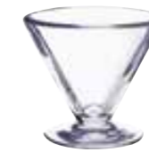
Coupe 6179 01 H : 7,8 cm Cl : 15 / Oz : 5,3 6 1080