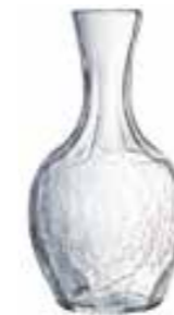
45/50 cl 5117 01 H : 18 cm Oz : 16