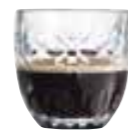
Tasse espresso fleurs

6375 01 H : 6,3 cm / ø : 6,2 cm Cl : 10 / Oz : 3,53 6 2784