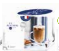
Mug Design La Racine

6435 01 H : 5,5 cm ø : 7,3 cm Cl : 10 / Oz : 3,53 6 1890