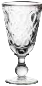
Verre à vin

6317 01 H : 16,5 cm / ø : 8,5 cm Cl : 23 / Oz : 8,1 6 672