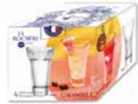
Set de 4 verres

6463 01 H : 13,4 cm ø : 8,1 cm Cl : 22 / Oz : 7,76 6.90LR2.80 6 768