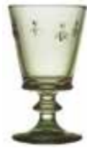
Verre à vin olive* 6110 97