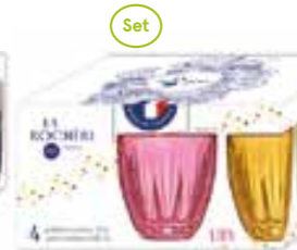
NEW Lily Set de 4 gobelets couleurs Design Christian Ghion

6338 96S4 H : 8,2 cm / ø : 7,8 cm Cl : 23 / Oz : 8,11 1248