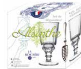
Set de dégustation

2 verres, 1 cuillère + 1 livret de cocktails