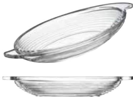
Banana split Bali 2

6102 01 H : 3,9 cm / ø : 25,5 cm Cl : 30 / Oz : 10,6 6 918