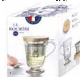
Tisanière 6446 01 27 Cl