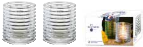
Set 2 Photophores transparents

6242 01B H : 7,8 cm / ø : 6,7 cm 13.90LR5.50 864