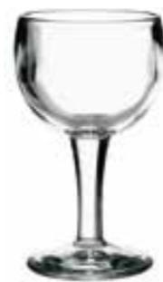
Verre à eau

6257 01 H : 13,4 cm / ø : 7,5 cm Cl : 14 / Oz : 4,9 6 768