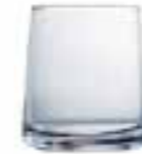
Gobelet uni 4088 01 H : 9,2 cm ø : 8,1 cm Cl : 30 Oz : 10,58