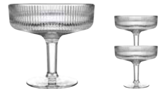
Coupe 6469 01 33 Cl