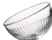
Coupe 6416 01 13 Cl