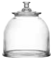
Bocal moyen modèle 4585 01 H : 16,5 cm / ø : 21 cm Cl : 385 / Oz : 135,8