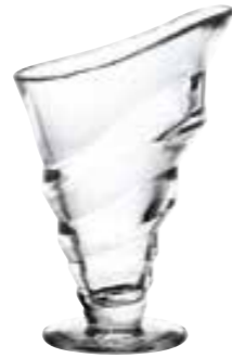
Circée haute 6239 01 H : 16,9 cm ø : 11,5 cm Cl : 27 / Oz : 9,52 6 504