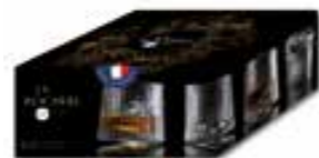
Blossom Gobelet à whisky Design J.François D'Or

6459 01 H : 6,5 cm / ø : 5,1 cm Cl : 4 / Oz : 1,41 1080