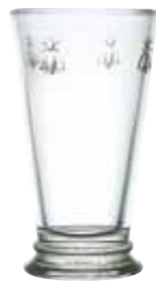
Maxi long drink

6371 01 H : 16 cm / ø : 9,5 cm Cl : 35 / Oz : 12,3 6 504