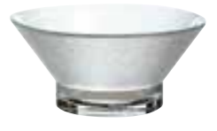
Coupe² 6287 01 H : 6 cm / ø : 7,8 cm Cl : 25 / Oz : 8,8 6 1026

*teinté masse/ Solid color * empilable / stackable