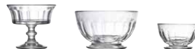
Coupe 2 6277 01 22 Cl