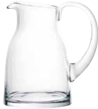
Broc 3 5783 01 H : 23,5 cm Cl : 250 / Oz : 88,2