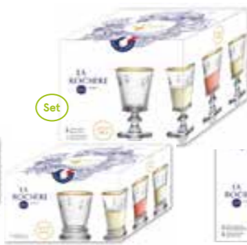
NEW Set de 4 gobelets bord or gold edition

6121 01S4 H : 10,3 / ø : 8,4 cm Cl : 26 / Oz : 9,2 240