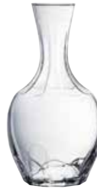
Carafe 100 cl 5144 01 H : 23,5 cm Oz : 35,3