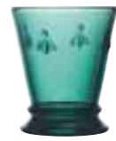
Gobelet Emeraude* 6121 03