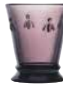
Gobelet Aubergine* 6121 08