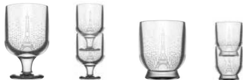
Verre à pied 2

6437 01 H : 12,5 cm / ø : 7,5 cm Cl : 25 / Oz : 8,82 6 960