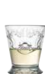
Gobelet 6293 01 25 Cl

Inspired by the iconic palace, Versailles is decorated with an elegant shell and flower motif, putting French grandeur at your fingertips. The collection draws from the palace's exquisite baroque panels and gardens, accented with scallop sea shells for a sophisticated style that translates seamlessly from everyday elegance to festive table.