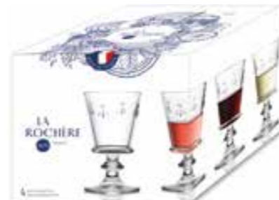
Set de 4 verres à vin

6085 01 H : 16,5 cm / ø : 6,7 cm Cl : 15 / Oz : 5,3 6 798