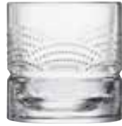
Verre à whisky Kaïto

6428 01 H : 9 cm / ø : 8,6 cm Cl : 30 / Oz : 10,58 4 1368