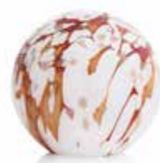
Luminaire Savane 1 4481 21 H : 21,5 cm / ø : 23 cm