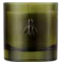
Envolée dans le verger Fig Figue

6449 97 H : 9,4 cm ø : 8,1 cm packed by 1