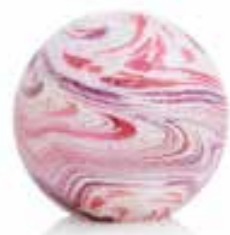
Luminaire Mandala 1 4481 11 H : 21,5 cm / ø : 23 cm