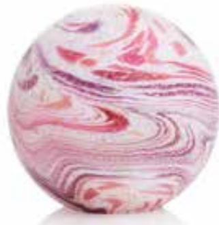
Luminaire MANDALA grand format 1 4141 11 H : 30 cm