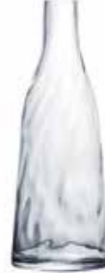
Carafe ondulée 4207 01 H : 27 cm ø : 10,1 cm Cl : 100 Oz : 35,27