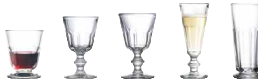
Gobelet 6351 01 23 Cl