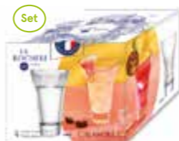
NEW Calanques set de 4 Verres à pastis

6336 01 H : 12,75 cm / ø : 9 cm Cl : 37 / Oz : 10,6 4 768