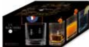
NEW Gobelets à whisky ABEILLE

6427 01 H : 9 cm / ø : 8,6 cm Cl : 30 / Oz : 10,58 420