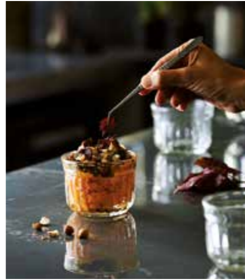
set 2 Délice avec couvercle en liège p 62 set 2 Delice with cork lid - p 62

6420 01 H : 7,3 cm / ø : 9,65 cm Cl : 29 / Oz : 10,23 6 3000 1536