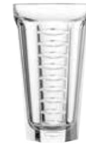
Long drink amande

6454 01 H : 9,3 cm ø : 9,2 cm Cl : 30 Oz : 10,58 1 1152