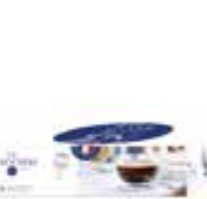
Tasse espresso Design La Racine

6435 01 H : 5,5 cm ø : 7,3 cm Cl : 10 / Oz : 3,53 6 1890