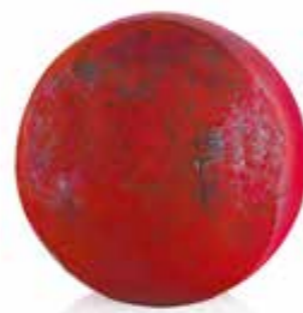
Luminaire ALBATRE grand format rouge 1 4141 09 H : 30 cm