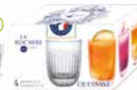
NEW Ouessant Set de 4 gobelets unis

6415 01 H : 8,2 cm / ø : 7,8 cm Cl : 23 / Oz : 8,11 364