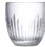
Gobelet jeux d'orgues

6406 01 H : 8,2 cm / ø : 7,8 cm Cl : 23 / Oz : 8,11 6 1152