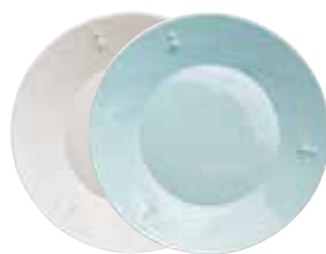
Assiette à dessert écru

5981 20 bleu 5981 63 < ø : 21,4 cm 4 760