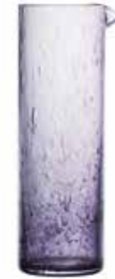
Broc bullé* 5286 04 H : 26,4 cm ø : 8,4 cm Cl : 100 Oz : 35,27