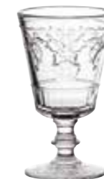
Verre à vin

6124 01 H : 14 cm / ø : 8,5 cm Cl : 34 / Oz : 11,99 6 768