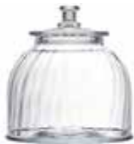
Bocal moyen modèle vénitien fin 4585 01VF H : 16,5 cm / ø : 21 cm Cl : 385 / Oz : 135,8