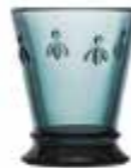
Gobelet Bleu nuit* 6121 48