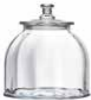
Bocal moyen modèle vénitien large 4585 01VL H : 16,5 cm / ø : 21 cm Cl : 385 / Oz : 135,8