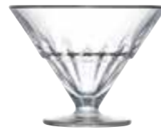
Excelsior basse 6417 01 H : 9,9 cm ø : 13 cm Cl : 35 / Oz : 12,35 6 360