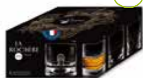
Set de 4 gobelets à whisky DANDY

6163 01 H : 7,47 cm / ø : 8,05 cm Cl : 16 / Oz : 5,65 4 1140