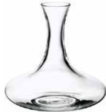
Surcouf 4123 01 H : 22,5 cm (sans bouchon) Cl : 150 / Oz : 52,9