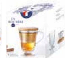
Tisanière Abeille (1 mug, 1 filtre à thé/infuser et 1 couvercle/solid wood lid)

6404 01 H : 11,7 cm / ø : 8,5 cm Cl : 36 / Oz : 12,7 540