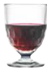
Verre petit modèle

6116 01 H : 12,6 cm / ø : 8,3 cm Cl : 28 / Oz : 9,88 6 912