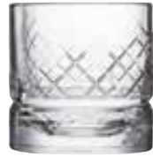
Verre à whisky Glen

6428 01 H : 9 cm / ø : 8,6 cm Cl : 30 / Oz : 10,58 4 1368