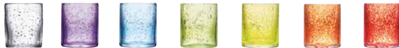
Gobelet whisky uni violet* bleu azur* vert* jaune* orange* rouge* 5287 01 H : 9,8 cm ø : 8 cm Cl : 35 / Oz : 12,35 5287 08 H : 9,8 cm ø : 8 cm Cl : 35 / Oz : 12,35 5287 32 H : 9,8 cm ø : 8 cm Cl : 35 / Oz : 12,35 5287 14 H : 9,8 cm ø : 8 cm Cl : 35 / Oz : 12,35 5287 38 H : 9,8 cm ø : 8 cm Cl : 35 / Oz : 12,35 5287 36 H : 9,8 cm ø : 8 cm Cl : 35 / Oz : 12,35 5287 25 H : 9,8 cm ø : 8 cm Cl : 35 / Oz : 12,35