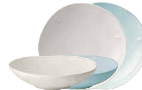
Assiette à dessert céramique bleu (packed by 4 pcs) 5981 63