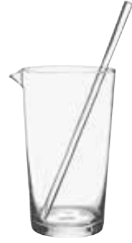
Verre 5534 01 H : 16,5 cm / ø : 8,5 cm Cl : 70 / Oz : 24,7