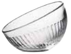
Coupe 6416 01 H : 9 cm / ø : 12 cm Cl : 13 / Oz : 4,6 6 810