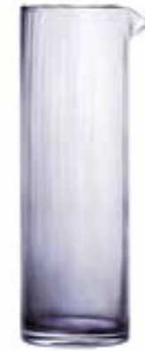
Broc vénitien fin* 5289 04VF H : 26,4 cm ø : 8,4 cm Cl : 100 Oz : 35,27