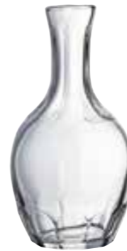
75 cl 5142 01 H : 22 cm Oz : 26,5