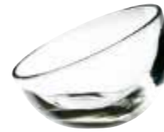
Coupe 6178 01 H : 9 cm / ø : 12 cm Cl : 13 / Oz : 4,6 6 810