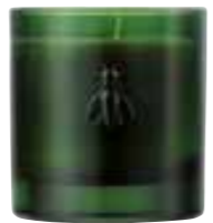
Envolée en Méditerranée Cedar Cèdre et cyprès

6449 14 H : 9,4 cm ø : 8,1 cm packed by 1