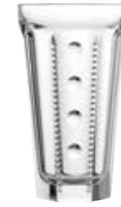
Long drink perles

6391 01 H : 14,5 cm ø : 8,44 cm Cl : 34,8 Oz : 12,28 1 768