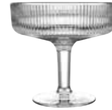
Coupe² 6469 01 H : 12 cm / ø : 12,6 cm Cl : 33 / Oz : 11,64 6 540