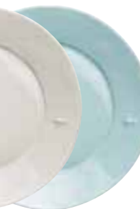
Assiette de service céramique bleu (packed by 4 pcs) 5982 63