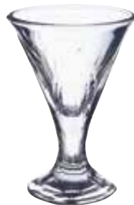
Fidji 6040 01 H : 15,3 cm / ø : 10 cm Cl : 20 / Oz : 7 6 576