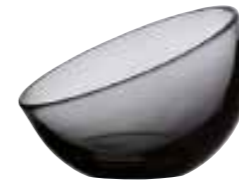
Coupe anthracite* 6178 10 H : 9 cm / ø : 12 cm Cl : 13 / Oz : 4,6 6 810