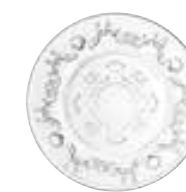
Asiette à pain 6322 01 ø : 14,65 cm