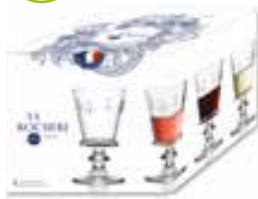
Set de 4 verres à vin

6464 01 H : 13,4 cm / ø : 8,1 cm Cl : 22 / Oz : 7,76 280