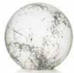
Luminaire globe 1 4481 62 H : 21,5 cm / ø : 23 cm