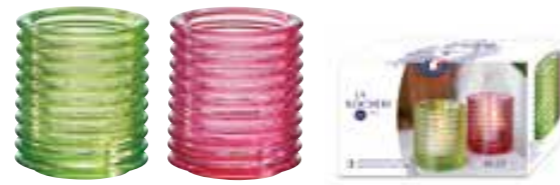
Set 2 Photophores vert et rose

6242 01B H : 7,8 cm / ø : 6,7 cm 13.90LR5.50 864