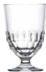
Verre grand modèle

6132 01 H : 15,3 cm / ø : 8 cm Cl : 38 / Oz : 13,4 6 912