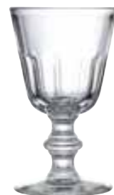
Verre à vin

6351 01 H : 10,5 cm / ø : 8,5 cm Cl : 23 / Oz : 8,11 6 1152