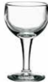
Verre à vin rouge

6257 01 H : 13,4 cm / ø : 7,5 cm Cl : 14 / Oz : 4,9 6 768