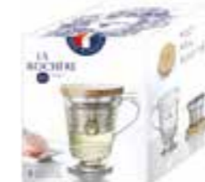
Tisanière Versailles (1 mug, 1 filtre à thé/infuser et 1 couvercle/solid wood lid)

6422 01 H : 11,5 cm / ø : 8,5 cm Cl : 27 / Oz : 9,52 504