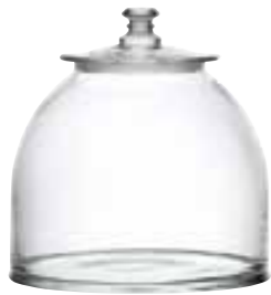
Bocal grand modèle 4587 01 H : 22,5 cm / ø : 27 cm Cl : 900 / Oz : 317,46