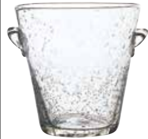
Bullé 58 00 H : 24 cm ø : 24 cm