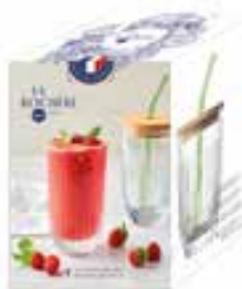
Smoothie 6465 01 45 Cl