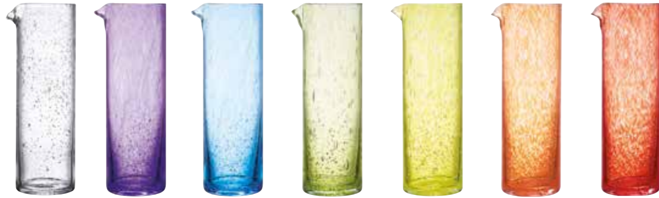
Broc uni violet* bleu azur* vert* jaune* orange* rouge* 5286 01 H : 26,4 cm ø : 8,4 cm Cl : 100 Oz : 35,27 5286 08 H : 26,4 cm ø : 8,4 cm Cl : 100 Oz : 35,27 5286 32 H : 26,4 cm ø : 8,4 cm Cl : 100 Oz : 35,27 5286 14 H : 26,4 cm ø : 8,4 cm Cl : 100 Oz : 35,27 5286 38 H : 26,4 cm ø : 8,4 cm Cl : 100 Oz : 35,27 5286 36 H : 26,4 cm ø : 8,4 cm Cl : 100 Oz : 35,27 5286 25 H : 26,4 cm ø : 8,4 cm Cl : 100 Oz : 35,27