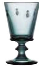
Verre à vin Bleu nuit* 6110 48