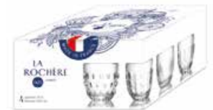
Set de 4 gobelets assortis

6409 01 H : 8,2 cm / ø : 7,8 cm Cl : 23 / Oz : 8,11 6 1152