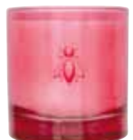
Fleur du levant Mûres, de fleur de cerisier, patchouli... Blackberry, cherry blossom, patchouli...

6449 07 H : 9,4 cm / ø : 8,1 cm packed by 1