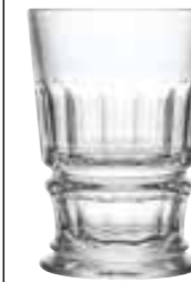
Verre à cocktail

6336 01 H : 12,75 cm ø : 9 cm Cl : 37 / Oz : 13 4 768