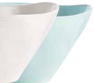
Saladier céramique bleu (packed by 1 pc) 5980 63 330 Cl