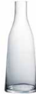
Carafe unie 4153 01 H : 27 cm ø : 10,1 cm Cl : 100 Oz : 35,27