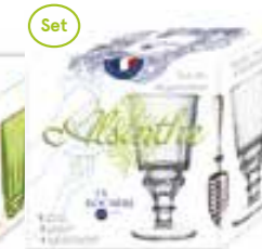
Set Absinthe 2 verres, 1 cuillère + 1 livret de cocktails

6144 96S4 H : 9 cm / ø : 8,6 cm Cl : 25 / Oz : 8,82 312