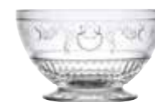
Bol 6301 01 60 Cl