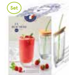
NEW Set verre à smoothies 1 long drink, 1 paille en verre verte, 1 couvercle en bambou et 1 brosse de nettoyage

6473 01 (Set) H : 16 cm ø : 9 cm Cl : 46 / Oz : 16,23 378