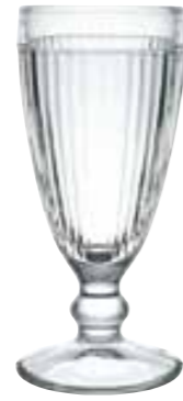
Antillaise 6029 01 H : 18,4 cm / ø : 12 cm Cl : 29 / Oz : 10,2 6 504