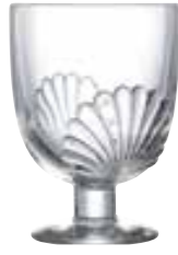
Verre à pied

6411 01 H : 11,4 cm / ø : 8,3 cm Cl : 29 / Oz : 8,82 6 1140