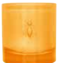
Fleur d'Orient Prune, cuir, notes solaires, santal Plum, leather, solar notes, santalwood

6449 38 H : 9,4 cm / ø : 8,1 cm packed by 1