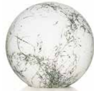
Luminaire ALBATRE grand format blanc 1 4141 62 H : 30 cm