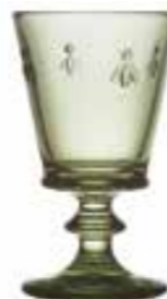
Verre à vin*

6110 97 H : 14,1 cm / ø : 8,5 cm Cl : 24 / Oz : 8,5 6 768