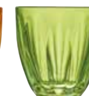
Gobelet kiwi 6144 14 25 Cl