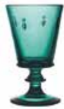
Verre à vin Emeraude* 6110 03