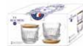
Set 2 tasses avec couvercles bois 646601 25 Cl