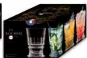
Club Verre à cocktail

6444 01 H : 14,5 cm / ø : 8,44 cm Cl : 34,8 / Oz : 12,28 4 224