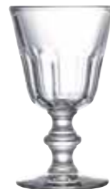
Verre à eau

6210 01 H : 14 cm / ø : 8 cm Cl : 19 / Oz : 6,7 6 768