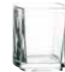
Mise en bouche 2

6227 01 H : 5,2 cm Cl : 5 / Oz : 1,8 6 3000 5130