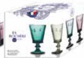
Set de 4 verres à vin 4 couleurs assorties 6110 9654