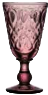
Verre à vin améthyste*

6317 01 H : 16,5 cm / ø : 8,5 cm Cl : 23 / Oz : 8,1 6 672