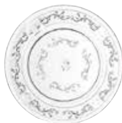
Assiette à dessert