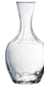
45/50 cl 5116 01 H : 18 cm Oz : 16