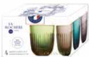
Set de 4 gobelets couleurs assorties*

6338 96S4 H : 9,5 cm / ø : 8 cm Cl : 26 / Oz : 9,17 6 364