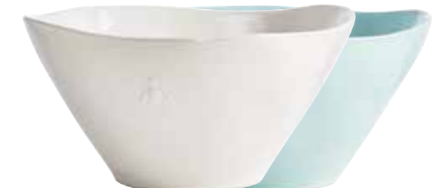
Saladier céramique écru (packed by 1 pc) 5980 20 330 Cl