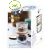
Set de 2 Délice grand modèle couvercle liège verre trempé/tempered glass Design La Racine

6403 01 H : 6,5 cm ø : 9,5 cm Cl : 7 / Oz : 2,47 1155