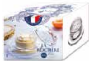
Beurrier Versailles (1 coupelle et 1 cloche)

6402 01 H : 6,5 cm / ø : 9,5 cm Cl : 7 / Oz : 2,47 1155