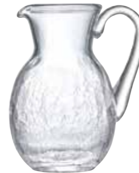
Broc à anse transparent

5293 01 H : 21,3 cm ø : 16 cm Cl : 150 Oz : 52,9