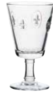
Verre à vin

6291 01 H : 10,3 cm / ø : 8,7 cm Cl : 25 / Oz : 8,8 6 1152