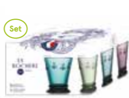
Set de 4 gobelets couleurs assorties

6110 96S4 H : 14,1 cm / ø : 8,5 cm Cl : 24 / Oz : 8,5 192