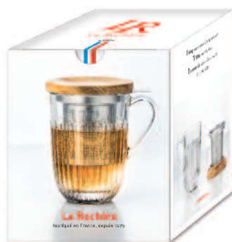
Tisanière Ouessant (1 mug, 1 filtre à thé et 1 couvercle en acacia) 6404 01 H : 13 cm / ø : 9 cm Cl : 40 / Oz : 14,11 22.00LR8.80