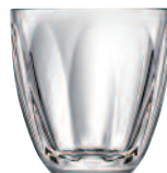
gobelet 6144 01 H : 9 cm / ø : 8,6 cm Cl : 25 / Oz : 8,82 5.40LR2.17

Designer de renom, Christian Ghion dévoile pour la première fois sa passion pour le verre en 1999 avec sa collection de vases « Inside out ». Au fil des années, il a su imposer son nom tant en France qu'à l'étranger. Fort d'une créativité affirmée et atypique, il continue à faire vibrer sa passion pour le verre. En 2018, il découvre une approche industrielle du matériau et conçoit Boudoir, une collection contemporaine et évocatrice d'instant suspendus emplis de douceur de vivre.