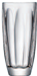
Long drink 6145 01 H : 15,4 cm / ø : 7,4 cm Cl : 35 / Oz : 12,35 5.80LR2.32