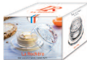
Beurrier Versailles 6403 01 H : 6,5 cm / ø : 9,5 cm Cl : 7 / Oz : 2,47 8.90LR3.60