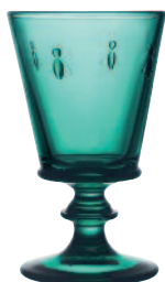
Verre à vin émeraude* 6110 03 H : 14,1 cm / ø : 8,5 cm Cl : 24 / Oz : 8,5 6.90LR2.77