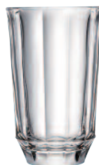
Long drink 6399 01 H : 13,3 cm / ø : 8,4 cm Cl : 37 / Oz : 13,05 5.70LR2.27