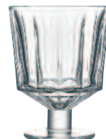
Verre à pied 6386 01 H : 11,4 cm / ø : 8,6 cm Cl : 26 / Oz : 9,17 5.40LR2.17