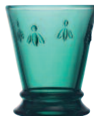
Gobelet émeraude* 6121 03 H : 10,3 cm / ø : 8,4 cm Cl : 26 / Oz : 9,2 6.50LR2.63