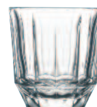
Gobelet 6387 01 H : 8,9 cm / ø : 8,4 cm Cl : 25 / Oz : 8,82 5.30LR2.11