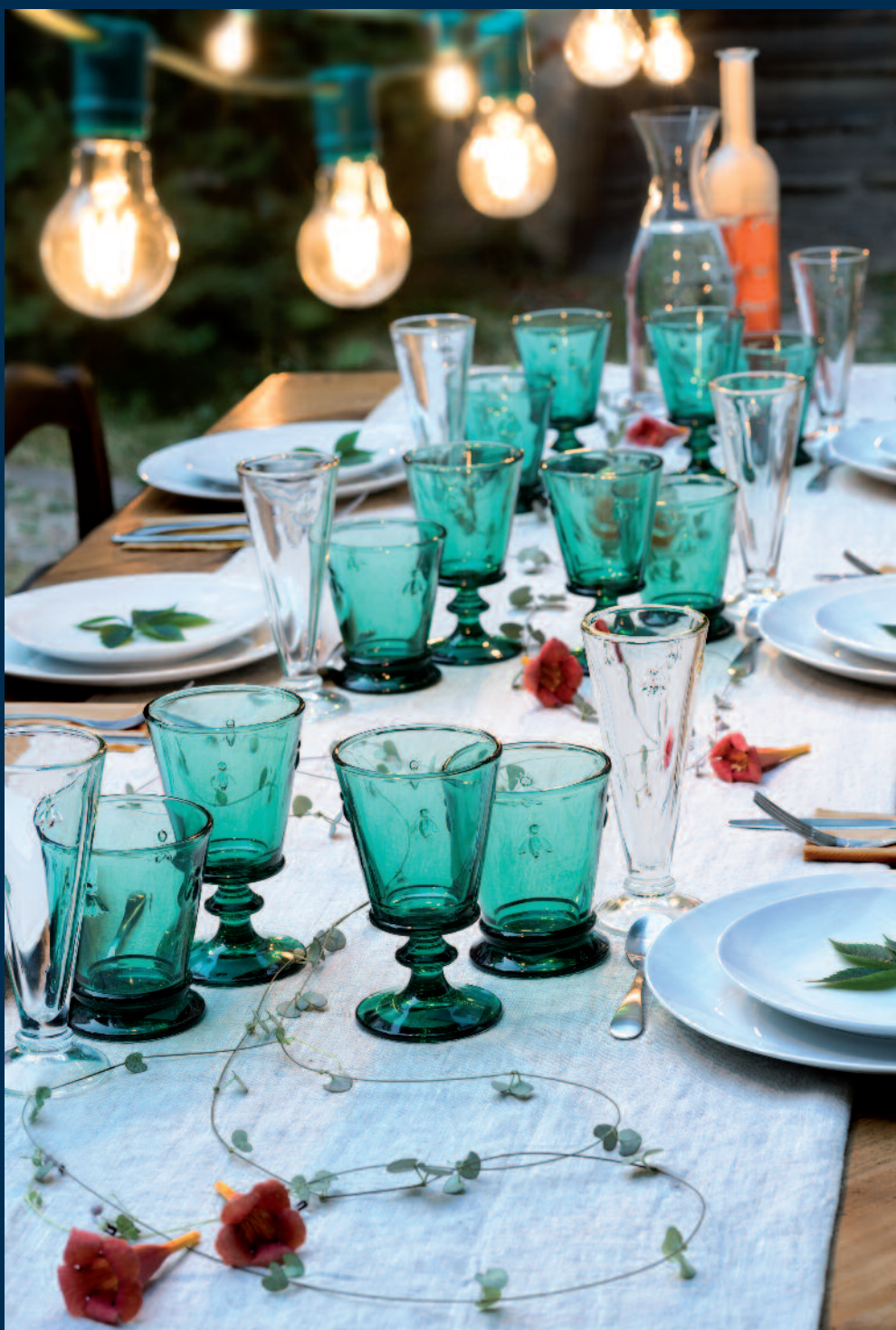
Service Abeille émeraude