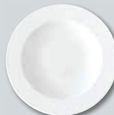
OCR-Nr. 16-2238-3010 Ø 290 mm · 11 ¼ in. Soup plate · Assiette creuse · Teller tief Plato hondo · Piatto fondo OCR-Nr. 16-2238-2700 Ø 230 mm · 9 in.