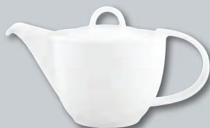
OCR-Nr. 16-2238-0530 0,40 l · 13 ½ ozs. Teapot · Théière · Teekanne · Tetera · Teiera