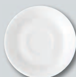
OCR-Nr. 16-2238-1280 Ø 150 mm · 6 in. Saucer · Soucoupe · Untere · Plato para taza Piattino tazza (Cup, Tasse, Tasse, Taza, Tazza OCR-Nr. -1270, -1271, -1361, -2513, -2514)