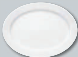
OCR-Nr. 16-2238-2720 320 x 240 mm · 12 ½ x 9 ½ in. Oval plate · Assiette ovale · Teller oval Fuente ovalada · Piatto ovale