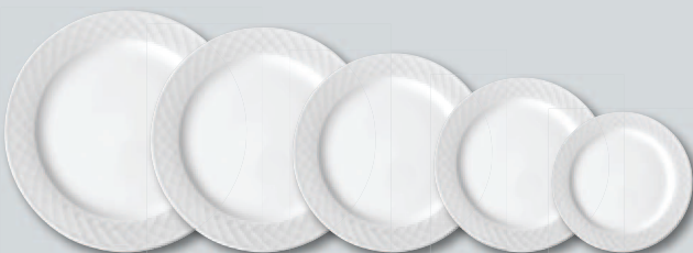
OCR-Nr. 16-2238-2600 Ø 290 mm · 11 ¼ in. Flat plate · Assiette plate · Teller flach Plato llano · Piatto piano OCR-Nr. 16-2238-2620 Ø 270 mm · 10 ½ in.