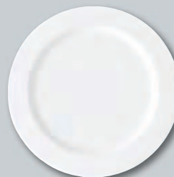
OCR-Nr. 16-2238-2800 Ø 320 mm · 12 ½ in. Round platter · Plat rond · Platte rund Fuente redonda · Piatto tondo