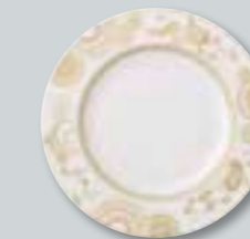
OCR-Nr. 10-4382-2630 Flat plate · Assiette plate · Teller flach · Plato llano · Piatto piano Ø 270 mm · 10 ½ in.