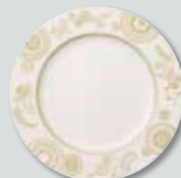
OCR-Nr. 10-4382-2810 Round platter · Plat rond · Platte rund · Fuente redonda · Piatto tondo Ø 330 mm · 13 in.