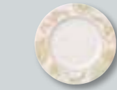
OCR-Nr. 10-4382-2660 Flat plate · Assiette plate · Teller flach · Plato llano · Piatto piano Ø 160 mm · 6 ¼ in.