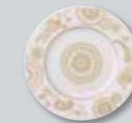
OCR-Nr. 10-4382-2650 Flat plate · Assiette plate · Teller flach · Plato llano · Piatto piano Ø 220 mm · 9 in.