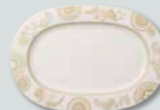
OCR-Nr. 10-4382-2940 Oval platter · Plat ovale · Platte oval Fuente ovalada · Piatto ovale 410 mm · 16 ¼ in