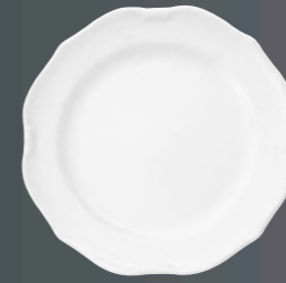
OCR-Nr. 16-3318-2800 Ø 320 mm · 12 ½ in. Round platter · Plat rond · Platte rund Fuente redonda · Piatto grande rotondo