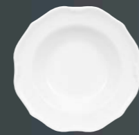
OCR-Nr. 16-3318-2700 Ø 240 mm · 9 ½ in. Soup plate · Assiette creuse · Teller tief Plato hondo · Piatto fondo