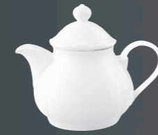
OCR-Nr. 16-3318-0530 0,40 l · 13 ½ ozs. Teapot · Thière · Teekanne · Tetera · Teiera