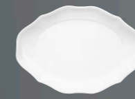
OCR-Nr. 16-3318-3570 240 mm · 9 ½ in. Oval pickle dish · Ravier ovale Beilagenschale oval · Rabanera ovalada Raviera ovale