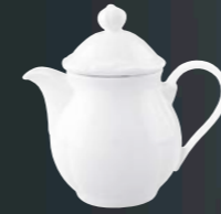
OCR-Nr. 16-3318-0220 0,30 l · 10 ¼ ozs. Coffeepot · Cafetière · Kaffeekanne Cafetera · Caffettiera