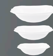
OCR-Nr. 16-3318-3320 210 mm · 8 ¼ in. Salad square bowl · Saladier carré Salatschale quadratisch · Ensaladera cuadrada · Insalatiera quadrata OCR-Nr. 16-3318-3330 180 mm · 7 in. OCR-Nr. 16-3318-3825 150 mm · 6 in.