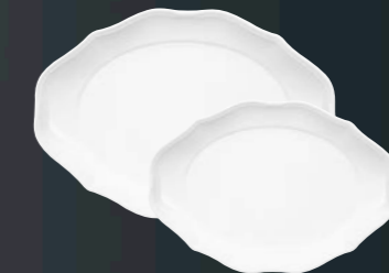
OCR-Nr. 16-3318-2710 360 x 260 mm · 14 x 10 ¼ in. Oval flat plate · Assiette plate ovale Teller flach, oval · Plato llano ovalado Piatto piano ovale OCR-Nr. 16-3318-2720 300 x 230 mm · 12 x 9 in.