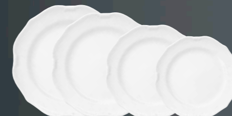
OCR-Nr. 16-3318-2600 Ø 290 mm · 11 ¼ in. Flat plate · Assiette plate · Teller flach Plato llano · Piatto piano OCR-Nr. 16-3318-2620 Ø 270 mm · 10 ½ in. OCR-Nr. 16-3318-2630 Ø 240 mm · 9 ½ in. OCR-Nr. 16-3318-2640 Ø 210 mm · 8 ¼ in.