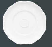
OCR-Nr. 16-3318-1250 Ø 190 mm · 7 ½ in. Saucer · Soucoupe · Untere · Plato para taza Piatino tazza (Cup, Tasse, Tasse, Taza, Tazza OCR-Nr. -1240, -2510, -2513)