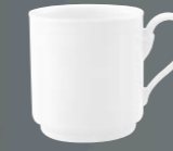
OCR-Nr. 16-3318-4879 0,27 l · 9 ozs. Mug stackable with handle Chope empilable avec anse Becher mit Henkel stapelbar Jarra apilable con asa Bicchiere sovrapponibile con manico