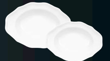
OCR-Nr. 16-3318-2761 290 x 210 mm · 11 x 8 ¼ in. Oval deep plate · Assiette creuse ovale Teller tief, oval · Plato hondo ovalado Piatto fondo ovale OCR-Nr. 16-3318-2760 255 x 185 mm · 10 x 7 ¼ in.